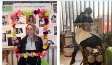
JOURNEE DE LA FEMME 8 MARS