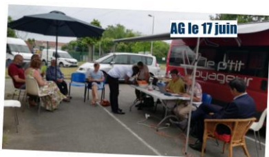
AG le 17 juin