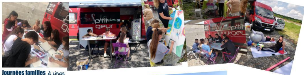
Journées familles à Linas