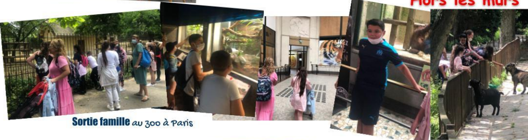
Sortie famille au zoo à Paris