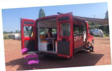
Animation CAF.FR à Gif sur Yvette le 20 juillet