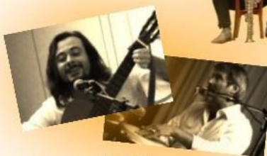
DJABAO Chansons françaises 19h