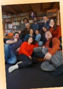
ZEMLJA Chants polyphoniques 16h15