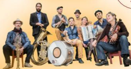
ULITZA Musiques des balkans 20h